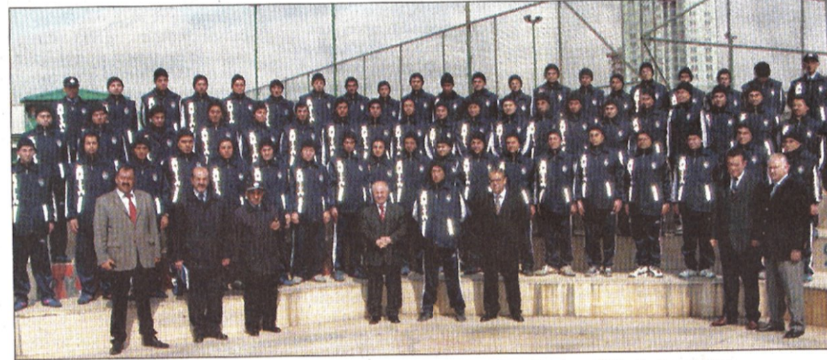
Yeni zabıta memurları mesleki eğitim dışında aikido eğitimi de aldılar...

K adıköy Belediyesi seyyar satıcı, korsan CD, kapkaç yapılaşma ve yıkım olaylarında görev alacak yeni zabıta memurlarını adeta rambu eğitiminden geçiriyor. Kamu Personel Sınavı'nda başarılı olarak memur olmaya hak kazananlar arasından seçilerek, ÖSYM tarafından Kadıköy Belediyesi'ne atanan 68 yeni zabıta memuru, iki aydır zorlu eğitimlerden geçiriliyordu. Uzmanların ve akademisyenlerin verdiği spor ve disiplin, genel kültür ve mesleki bilgiler hakkında çeşitli dersler gören zabıta memurları, deprem ve doğal afetler, halkla ilişkiler, şehirlik ile çevre, çalışma hayatında başarının sırları, belediye ve gecekondu mevzuatları, Türkiye'nin sosyal yapısı, fert ve toplum psikolojisi gibi çeşitli konularda da özel eğitimler aldılar.