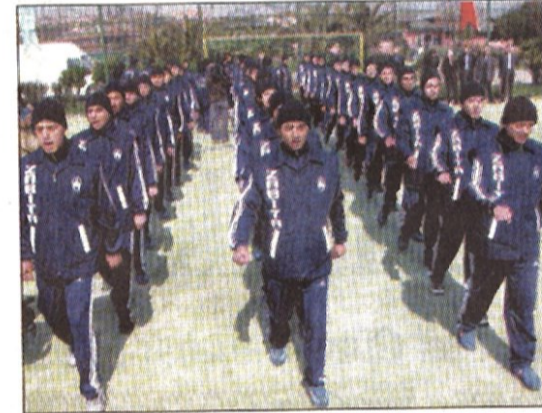
Zabıta, iki aylık eğitimden geçtiler..