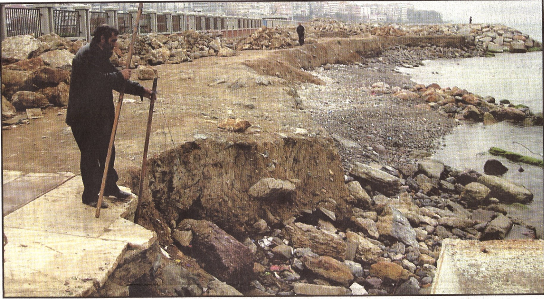
Kadıköylüler yaz mevsiminin yaklaştığı bugünlerde sahil yolunun en kısa zamanda düzenlenmesini istiyorlar.....